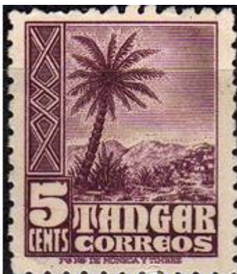
Tanger 1949 - de onbuigzame taaie dadelpalm betekent Tamars naam

Nu komt het doorzettingsvermogen, het voor zichzelf opkomen en het taaie van Tamar om de hoek kijken, ze zet deze eigenschappen in en bedenkt een list. Als ze ontdekt dat Juda naar een schaapscheerdersfeest gaat ontdoet zij zich van haar weduwenkleding maakt zich onherkenbaar door zich met een sluier te bedekken, en gaat bij Enaïm langs de weg naar Timna zitten en gedraagt zich als een hoer (vs.14). Dat zij dit plan opvat na de dood van Juda's vrouw is begrijpelijk.