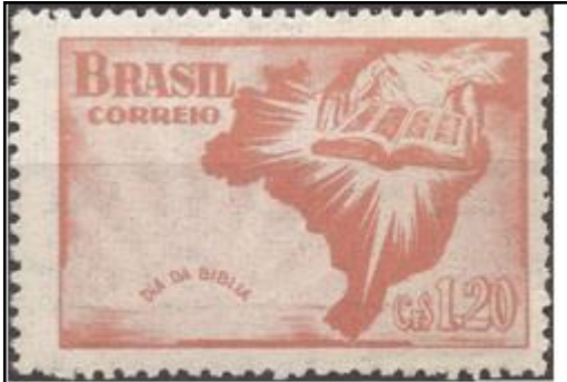
Brazilië 1951 - n.a.v. de Bijbeldag 1951 hier Landkaart, opengeslagen bijbel.

Als je de Bijbel leest ontcom je haast niet aan de indruk dat het eigenlijk best wel een mannenboek is. Toch is het velen gelukt om ook de vrouwen wat meer te belichten, denk b.v. aan de kunstenaars. Zo ook hier in mijn filatelistische en alfabetische werkstukjes over de bijzondere vrouwen in de Bijbel. We zitten